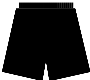
SHORT COM FORRO