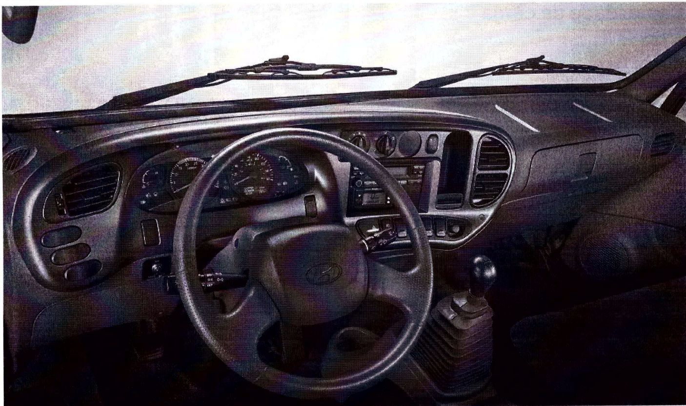
Painel é completo e conta com rádio e tacógrafo digital

O painel de instrumentos foi modernizado. Ganhou conta-giros (é verdade, o HD 78 não tinha) e computador de bordo com as funções pressão do sistema de freios pneumático, consumo de combustível médio e instantâneo, autonomia, velocidade média, tempo de rodagem, hodômetro parcial e total e relógio.