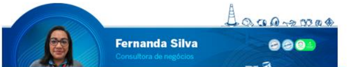
Imagem 04: cotação feita pelo fabricante Plastcor.