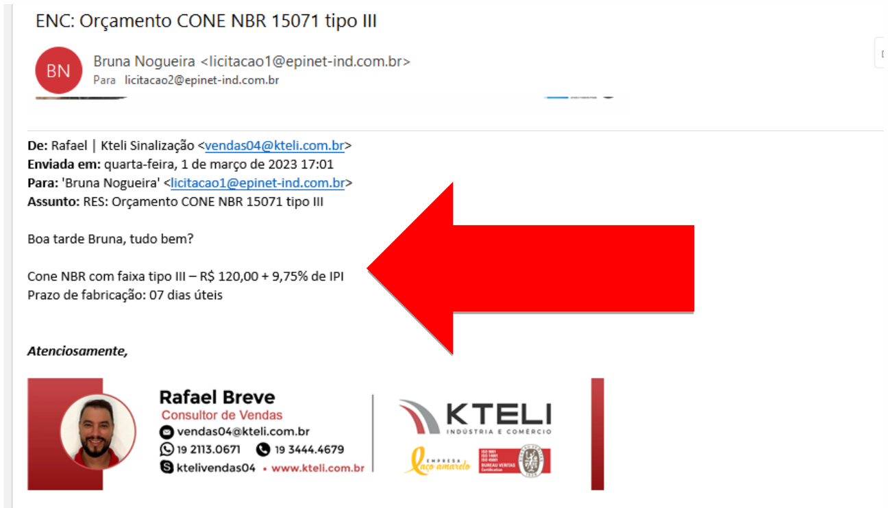
Imagem 02: cotação feita pelo fabricante Kteli.